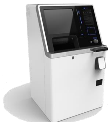
※画像は「be-ambitiousIV」(高機能タイプ)